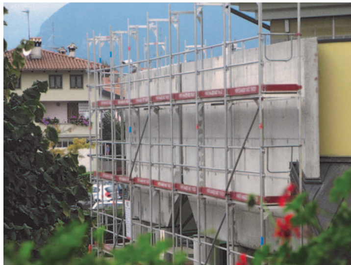
I lavori in corso