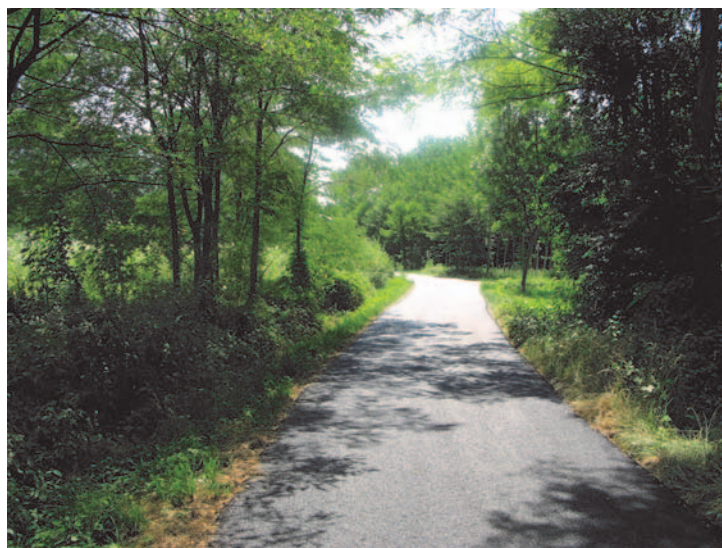
Il percorso ciclabile dei Salets

Per ultimo, è ora in progettazione, e sarà appaltata nei prossimi mesi, la sistemazione del tratto di via Sottocolle ancora sterrato, dalla trattoria La di Copet verso le case sottostanti il castello, che sarà dedicato ad esclusivo passaggio dei soli pedoni e biciclette. Per la prossima primavera si configura, quindi, il completo approntamento di tutto il percorso ciclabile di Artegna, dai confini di Gemona a quelli di Magnano in Riviera, attraverso i Salets, strada dei Lavars, borgo Val, Via Sottocolle, Via Del Trovo, Via Titins, Via Micossi, Via della Stazione.