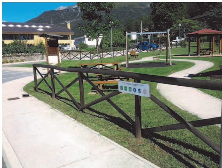
Ringhiera del Parco di Via Monte dipinta dai ragazzi

Come l'anno scorso, i progetti previsti erano due: il primo prevedeva l'affiancamento di quattro borsisti agli operatori dell'Associazione OCRA gestrice del centro estivo, mentre l'altro progetto prevedeva l'assunzione di sei ragazzi per svolgere alcuni lavori manuali e l'affiancamento ed il sostegno nello studio ai bambini delle scuole primarie e secondarie di primo grado (Progetto “Fasin i compits insieme” - seconda edizione). Quest'anno le domande presentate sono state 30, dav-